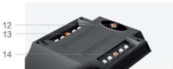
Верхняя часть (подсветка)