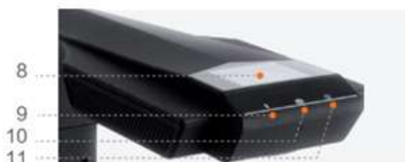
Верхняя часть (ЖК-дисплей)